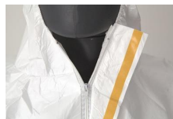
CHIUSURA A DUE STRATI