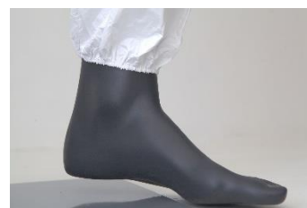
ELASTICO ALLA CAVIGLIA