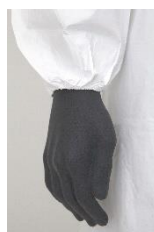
ELASTICO AL POLSO